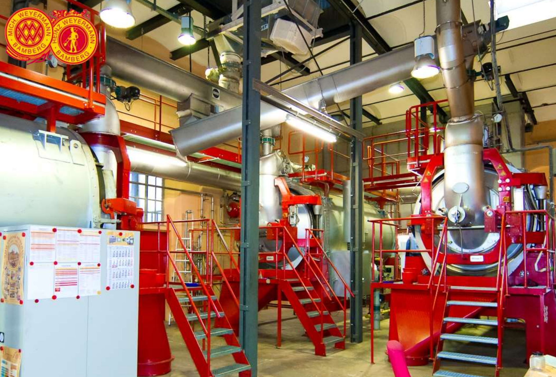
Weyermann® Caramelisierungs- und Rösttrommeln