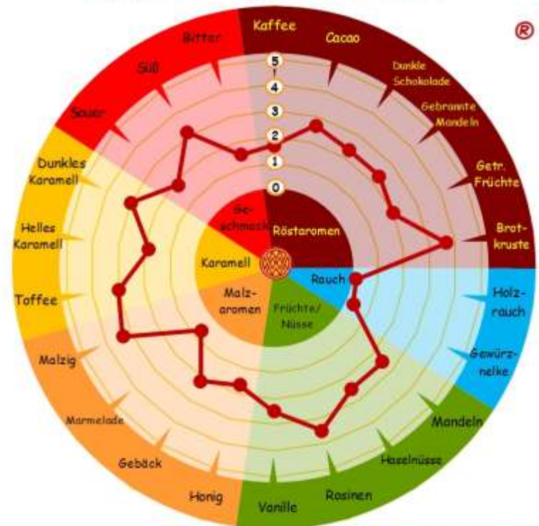
Weyermann® Malz Aroma Rad® Weyermann® Special W®: Würze